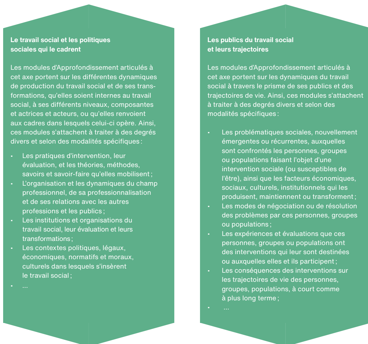
Figure 4 - les deux axes autour desquels s'articulent les modules d'Approfondissement

Chaque module vaut 6 crédits ECTS. Les étudiant·e·s doivent en valider 3, à choix, pour un total de 18 crédits ECTS.