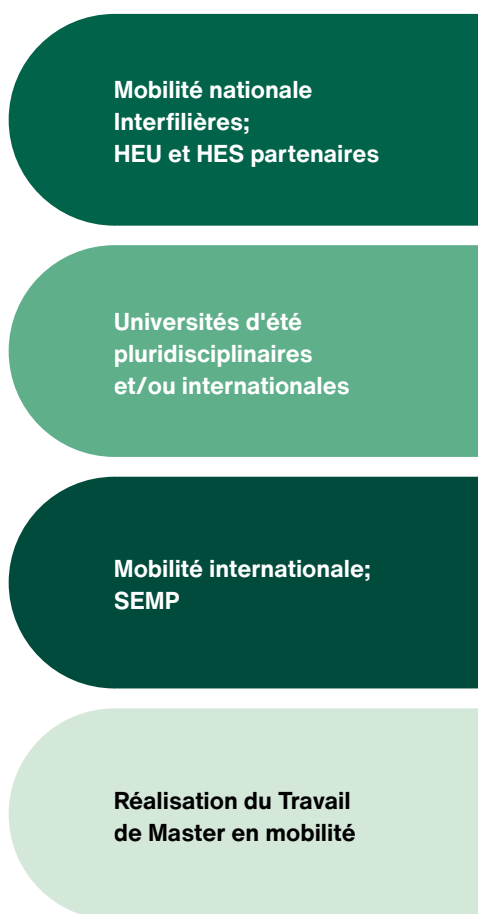
Figure 5 - Types de mobilité

Les projets de mobilité sont soumis à conditions et validés par la ou le Responsable de filière.