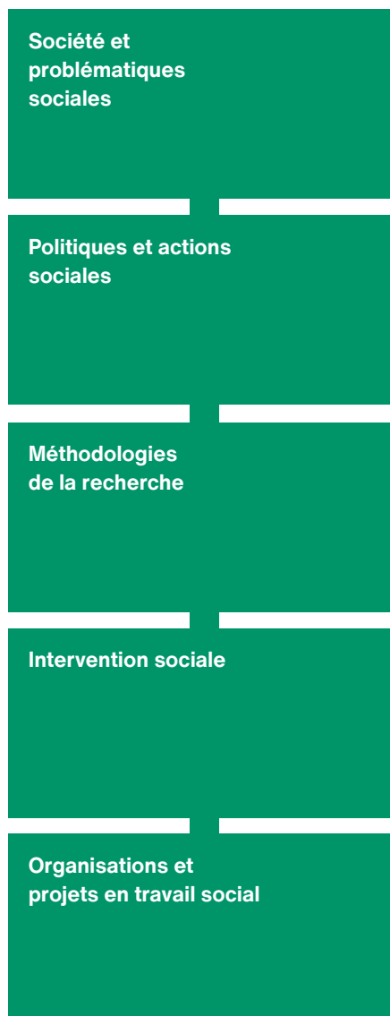
Figure 3 - Intitulé des 5 modules Essentiels

Chaque module Essentiel vaut 6 crédits ECTS. Ces modules sont obligatoires.