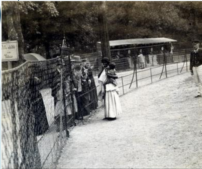
Exposition au jardin d'acclimatation de Vincennes, 1895